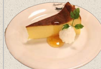
ベイクドチーズケーキ 580円