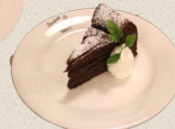
ガトーショコラ 580円